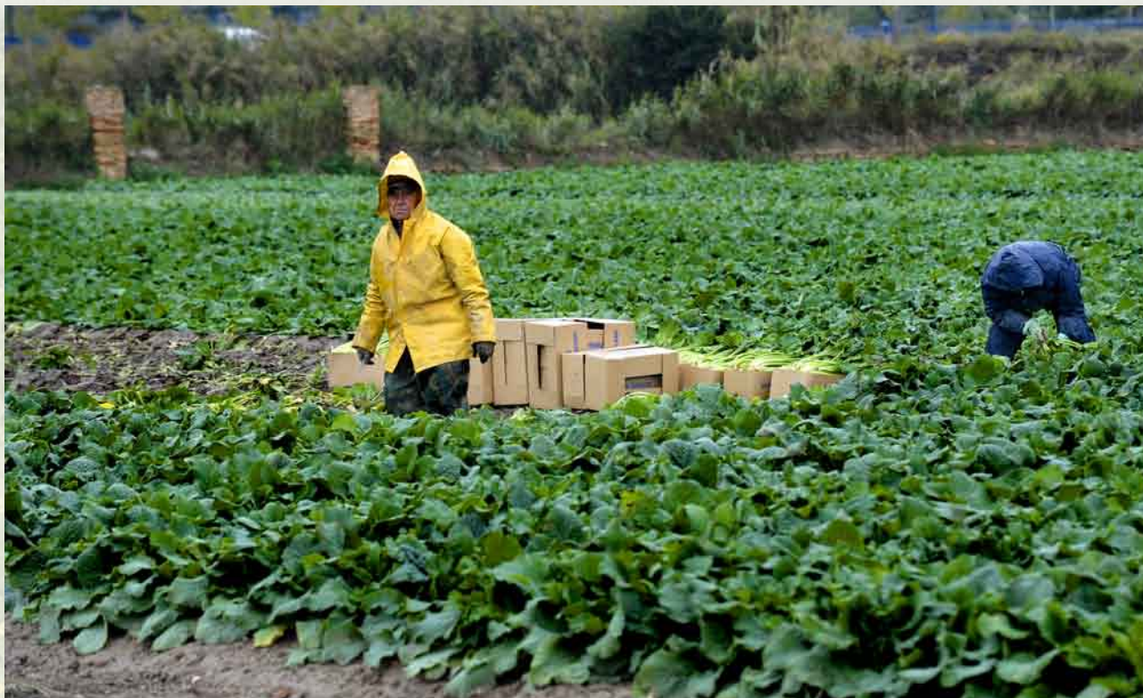
Varios propietarios señalan que sólo se planta hortaliza en unas pocas hectáreas, el resto están yermos por falta de rentabilidad,