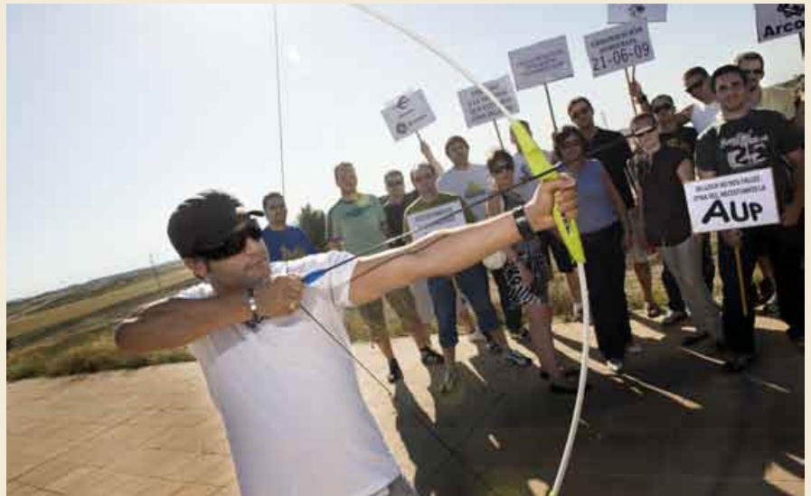
La Asociación de Vecinos de Arcosur ha protagonizado ya algunas movilizaciones para que comiencen a construir sus viviendas.

Corredor manifestó ser consciente de que en estos momentos "la mayor dificultad de acceso a la vivienda es el acceso al crédito". Por ello el Ministerio negociará con las entidades financieras y garantizará la compra de VPO a 100.000 familias españolas "solventes y responsables". Esta garantía, que