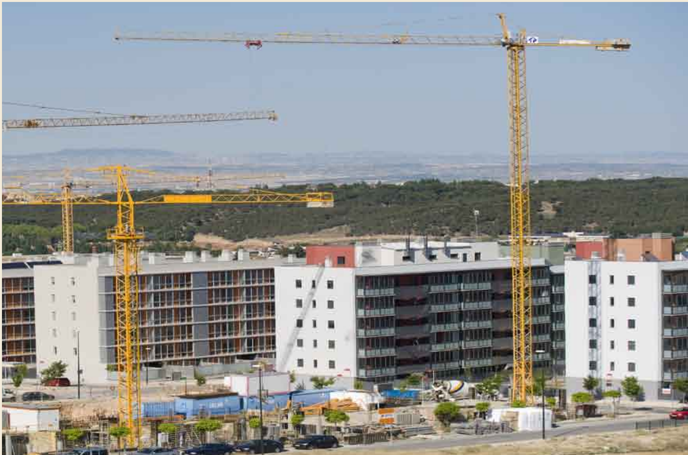
La delicada situación económica de los demandantes están dificultando el acceso de las familias a las VPO en Aragón.