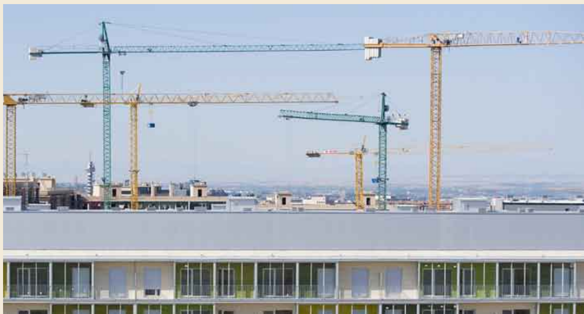
El Gobierno de Aragón ha comenzado a dar ayudas para que las familias puedan hacer frente a los pagos de una VPO.

sidencial y de vivienda protegida que existe en la actualidad en España. Se trata del sector 89/3, conocido como Arcosur , ubicado en los terrenos que quedan entre Valdespartera, la Feria de Muestras y Montecanal en Zaragoza. Allí, se levantarán más de 22.000 viviendas de las que unas 13.000 serán protegidas.