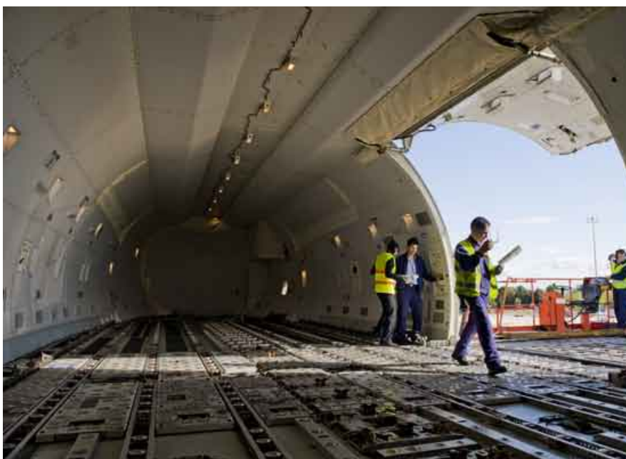
Inditex puede llegar a cargar hasta cien toneladas en los Jumbo contratados.

Pero esta reducción no es tan importante como el hecho de que la ciudad haya perdido cinco rutas regulares de pasajeros al aducir las aerolíneas una baja ocupación y unos resultados de explotación ruinosos, hasta el punto de tener que cerrar en el caso de Plaza Servicios Aéreos . Cuatro de estos enlaces eran nacionales ( Sevilla , Málaga , Vigo y Santiago ) y uno de ellos internacional ( Lisboa ). Y a