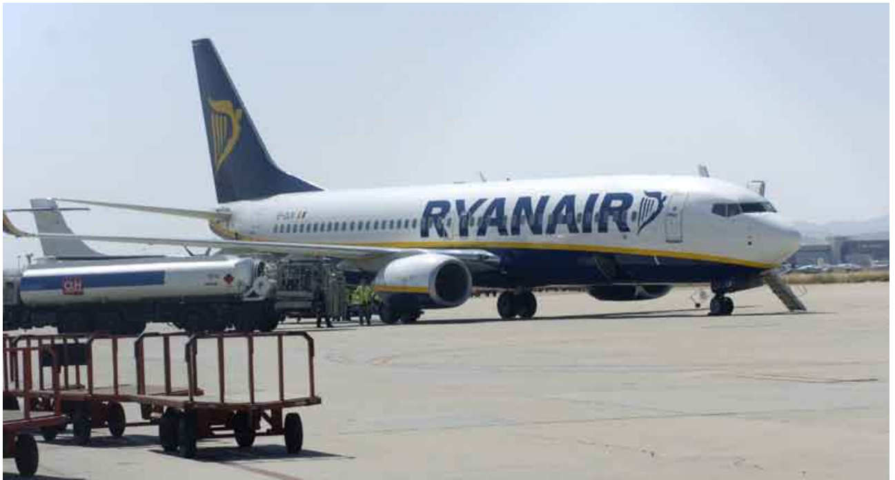
La compañía Ryanair podría confirmar en breve la apertura en Zaragoza de su quinta base de operaciones en España.

estos se une el fallido intento de Plaza con la ciudad de Toulouse en 2007.