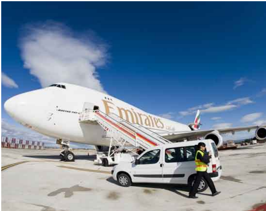
Emirates vuela dos veces por semana desde Zaragoza hasta Dubai.

actualmente en pruebas, traerá consigo un aumento de los vuelos. En su día llegó a operar una ruta regular con Halifax (Canadá), pero el accidente que tuvo el Jumbo de MK Airlines que lo cubría obligó a suspenderla. Se da por hecho que cuando la planta esté a pleno rendimiento en 2012 habrá más enlaces regulares, ya que Caladero necesitará alimentar un centro que procesará diariamente hasta 350 toneladas pescado, lo que supone más de 700.000 bandejas que se