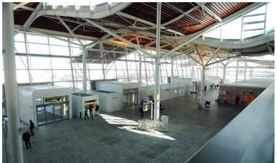
Las nueva terminal, estrenada para la Expo, se encuentra infrutilizada.

Su confirmación supondría un horizonte más que prometedor para las aspiraciones de Zaragoza de entrar en el mercado de las grandes ciudades europeas. ■