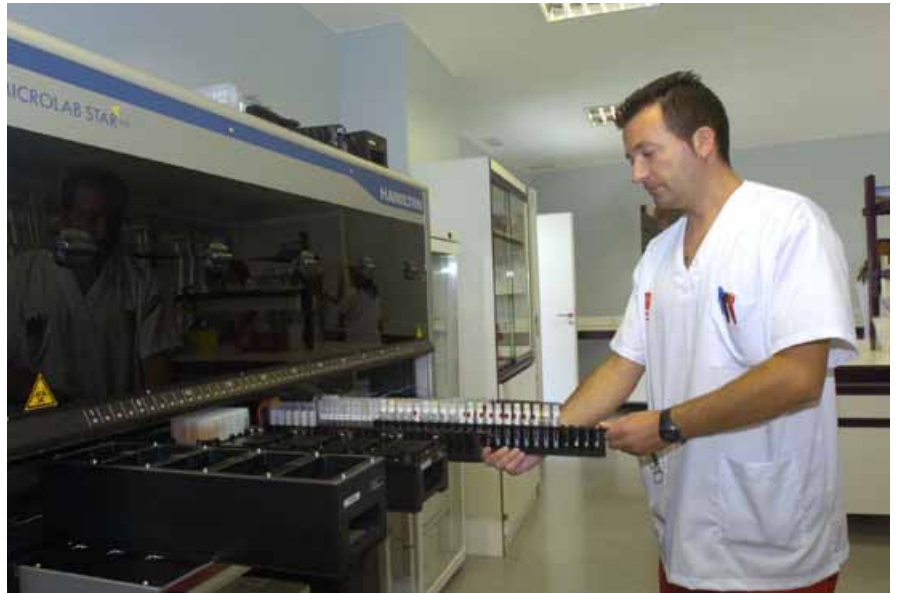
Las partidas para investigación, desarrollo y nuevas tecnologías tienen muy poco peso en el presupuesto.

Respecto de los ingresos, solo cabe decir que debido a la coyuntura económica que ha provocado un fuerte retroceso de la actividad económica (aumento del número