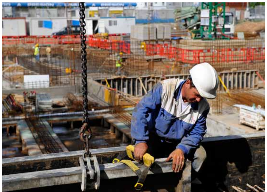
El descenso de la actividad económica ha provocado una importante reducción de los ingresos tributarios.

Por tanto, para mantener el presupuesto de gastos en niveles similares al año 2009 no queda otra posibilidad que aumentar el