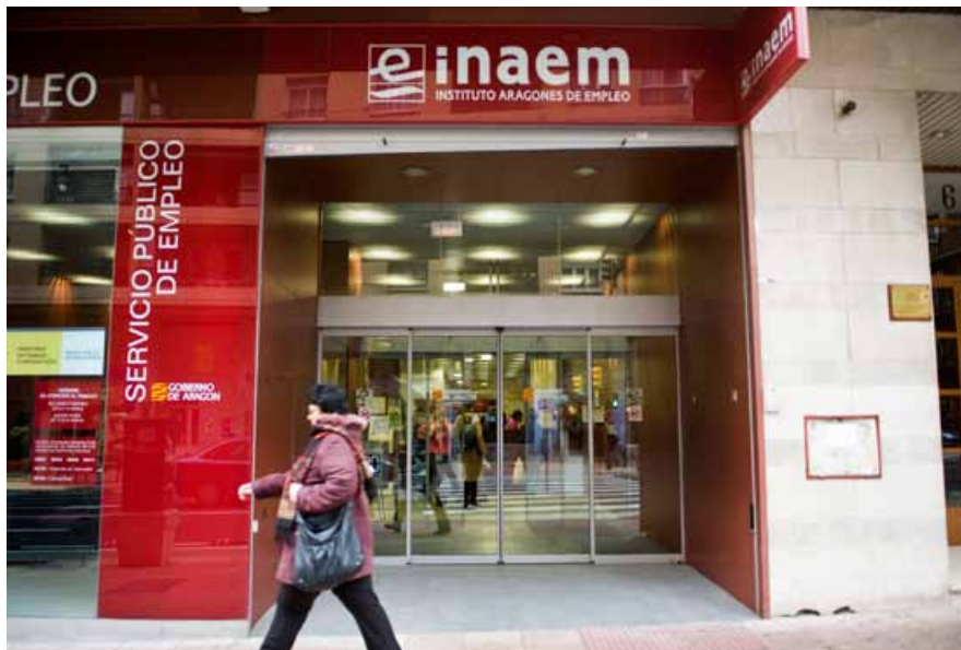
El presupuesto para Empleo y Relaciones Laborales descenderá un 2%.

cación y Vivienda prácticamente repiten cifras, si bien educación tal vez debiera verse reforzado, sino en la asignación económica, si en la racionalización del gasto. Pres-taciones Sociales se ve reducido en un 7% que parece razonable, la red familiar debe aportar re-