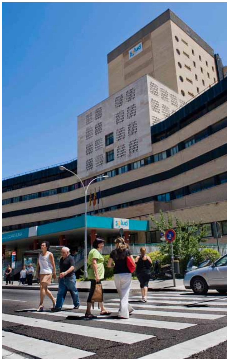
Sanidad supone prácticamente un tercio del presupuesto aragonés.

Lo que parece obvio es, que estamos ante los presupuestos más