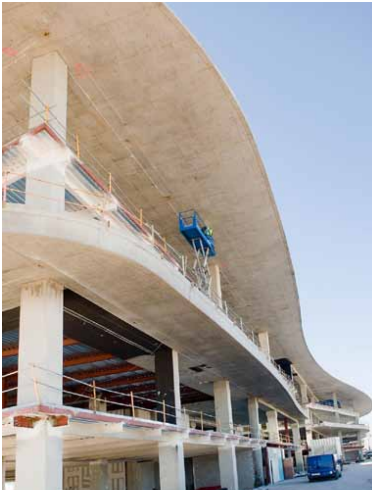
Los tres bloques de pabellones frente a la Ronda del Rabal se están reconviertiendo en doce edificios independientes

ción de la Audiencia Provincial , el Tribunal Superior de Justicia de Aragón y la Fiscalía .