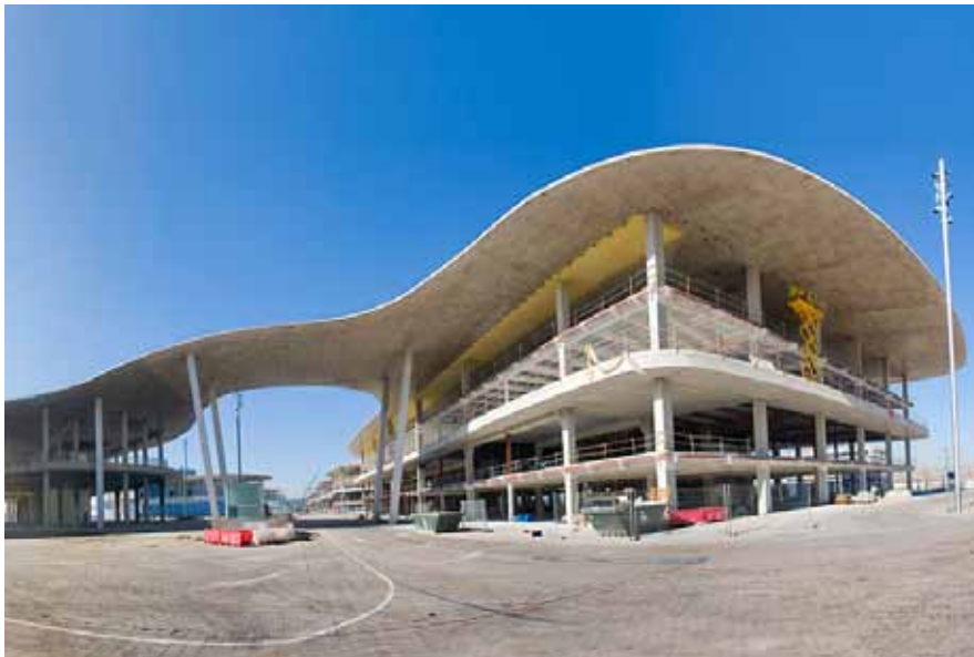
Sólo la techumbre superior recuerda a lo que en su día fueron los pabellones en la Expo 2008.