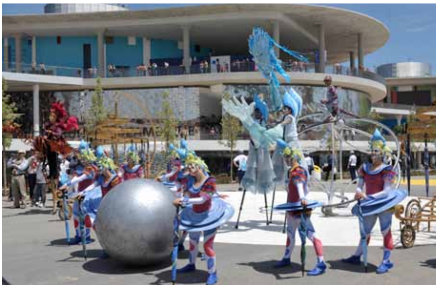
Lejos queda ya la imagen del recinto repleto de visitantes y en una fiesta continua.