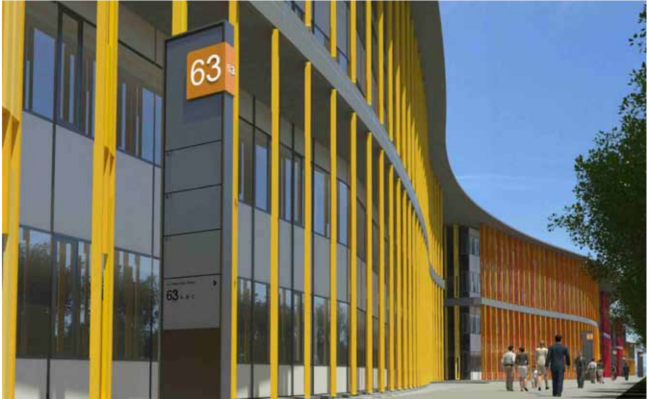
El parque empresarial lleva el sello del estudio Lamela, el mismo que diseñó la terminal T4 de Barajas.