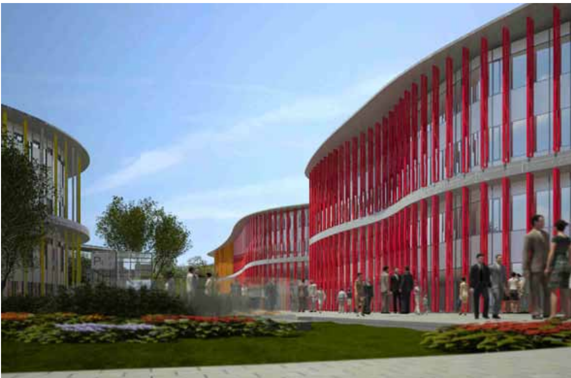
El espacio ocupado ahora por las máquinas se convertirá en un paseo ajardinado que unirá los edificios de oficinas.

Durante el año pasado se demolieron más de 9.000 metros cuadrados de hormigón para abrir lucernarios en la cubierta y crear patios de luz abiertos en estos blo-