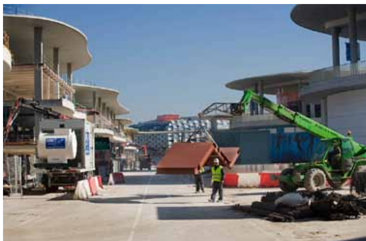
Los pabellones Ronda, a la izquierda, serán los primeros en ocuparse, en 2011.

La transformación de la Expo empieza a tomar cuerpo en Ranillas. Desde mediados de mes, luce el primer tramo de fachada de cristal de los antiguos pabellones, en plena reconversión en complejo empresarial. Las tres empresas adjudicatarias han concluido la nueva estructura de los edificios, que en unos meses han duplicado su superficie con la construcción de dos plantas intermedias en las dos existentes. En verano, cuando los edificios estén forrados por 25.000 metros cuadrados de cristal, se podrá contemplar la nueva imagen del meandro. Y a finales de año estará acabado la mitad del recinto.