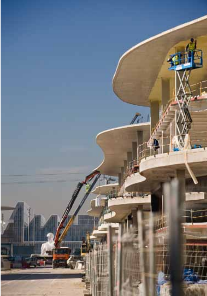
En los nuevos forjados se han empleado 2.900 toneladas de acero.

y Corea del Sur— y las demás contratistas, Sacyr y Dragados , harán lo propio en los próximos días en el resto de edificios situados frente a la Ronda del Rabal . "En cuatro meses, para finales de junio, las fachadas estarán terminadas", pronostica.