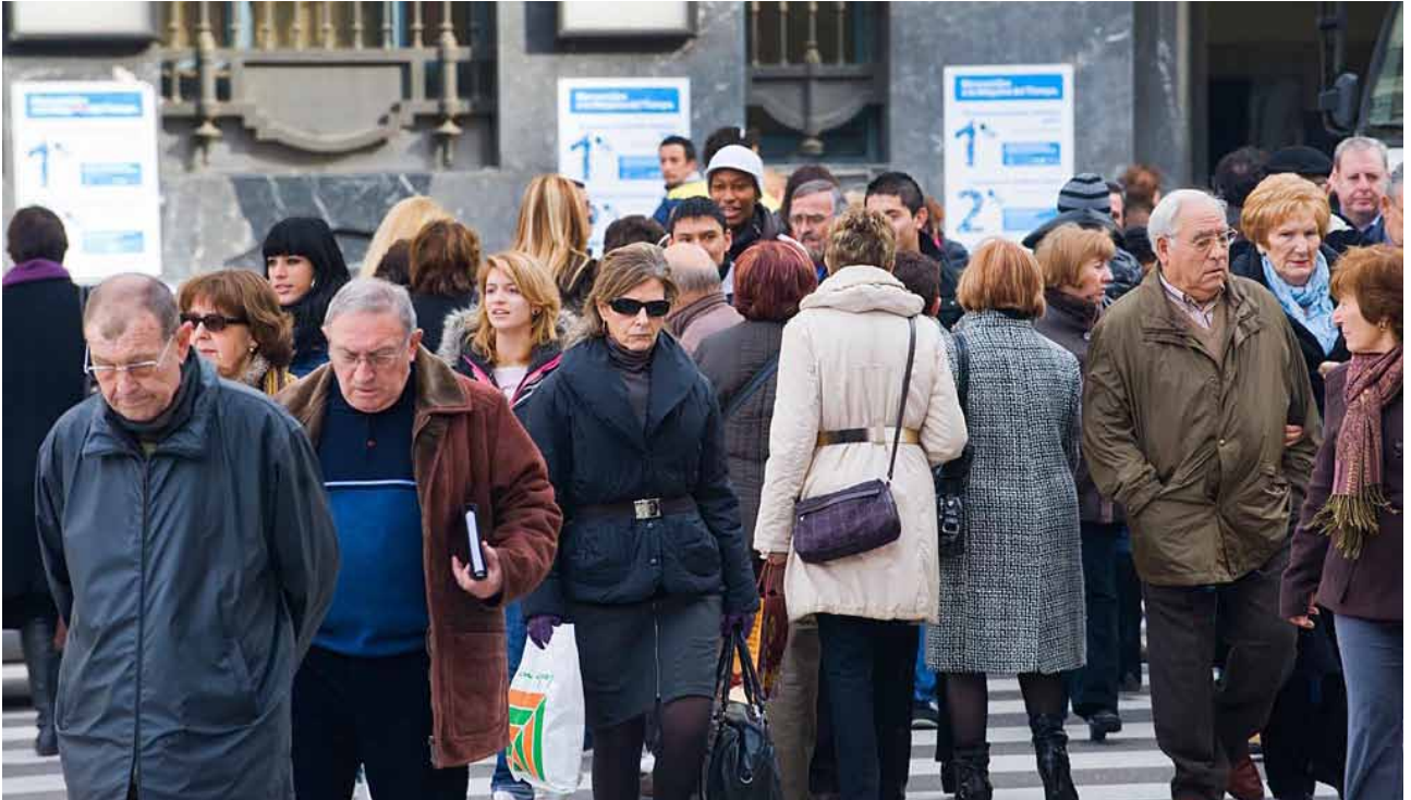
La esperanza de vida en España ha pasado de 76 a 80 años en el último cuarto de siglo, algo que afecta a la gestión de las pensiones.

Parece que la propuesta del " manifiesto de los 100 ", con algunos matices, no es nada descabellada y puede conjugar de manera razonable el mantenimiento de los derechos de los trabajadores con la reforma en profundidad del mercado laboral.