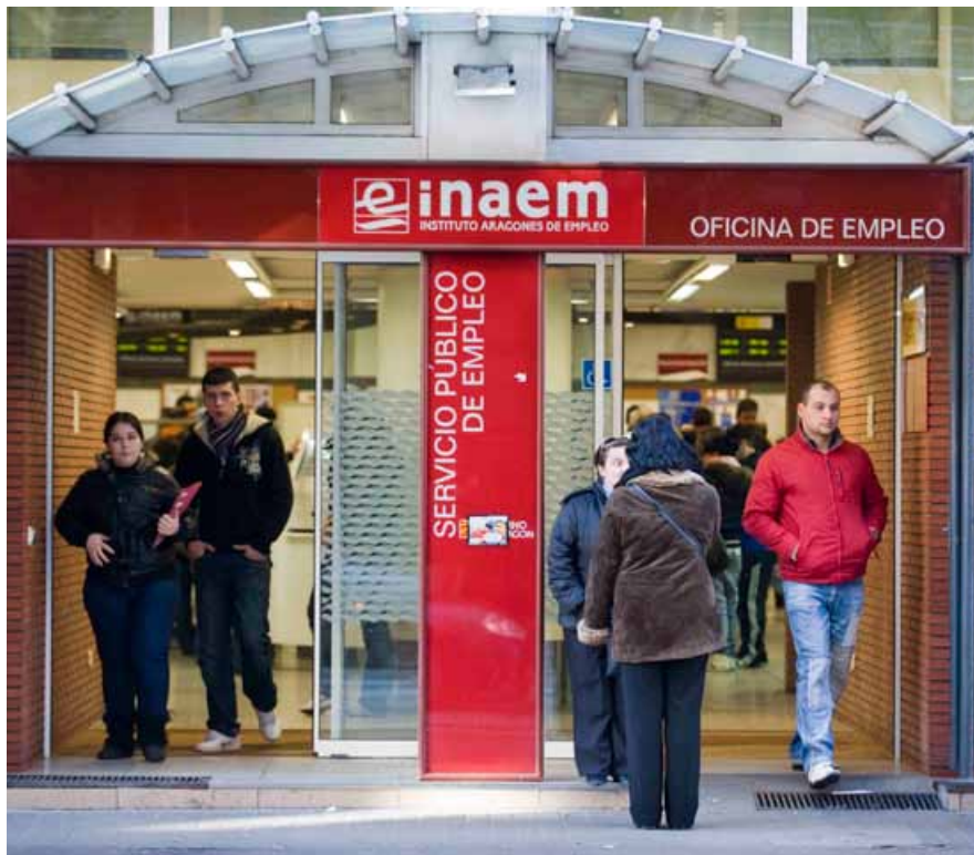
En Aragón existen unos 100.000 parados, lo que presenta una tasa de desempleo del 15%.

del contrato, son también muy dispares, así tenemos desde los 8 días para los contratos de formación, hasta los 45 días para los despidos improcedentes, pasando por los 33