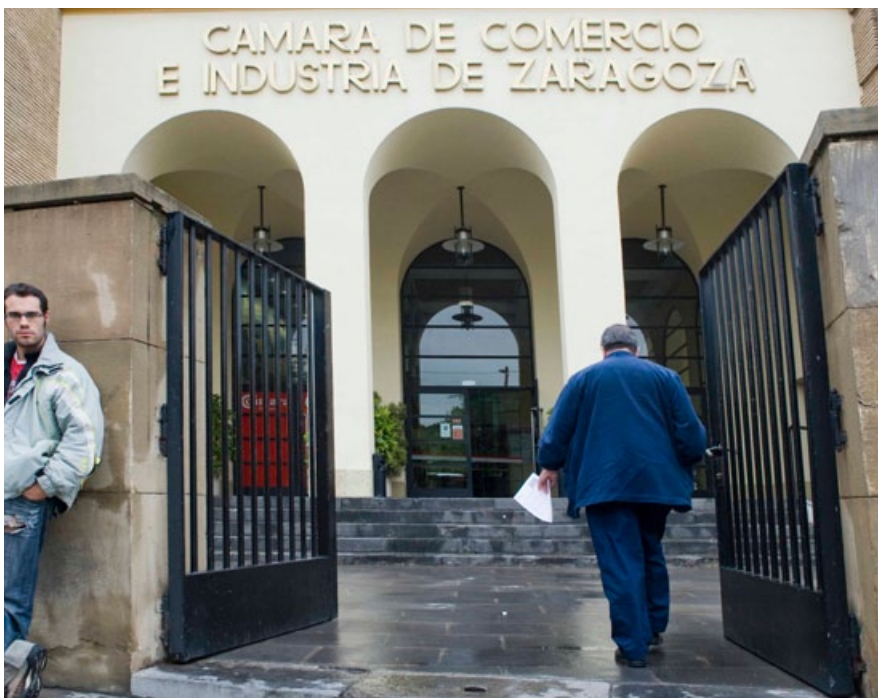
Sede de la Cámara de Comercio de Zaragoza.

Las empresas que se creen deben ir orientadas a sectores con futuro, que son los que pueden proporcionar viabilidad y crecimiento de la productividad, y en este sentido creo que las ayudas no deberían ser tan generalistas y se debería establecer un sesgo más marcado hacia los sectores y empresas que se quieren potenciar y que han de ser referencia en nuestro futuro más inmediato. ■