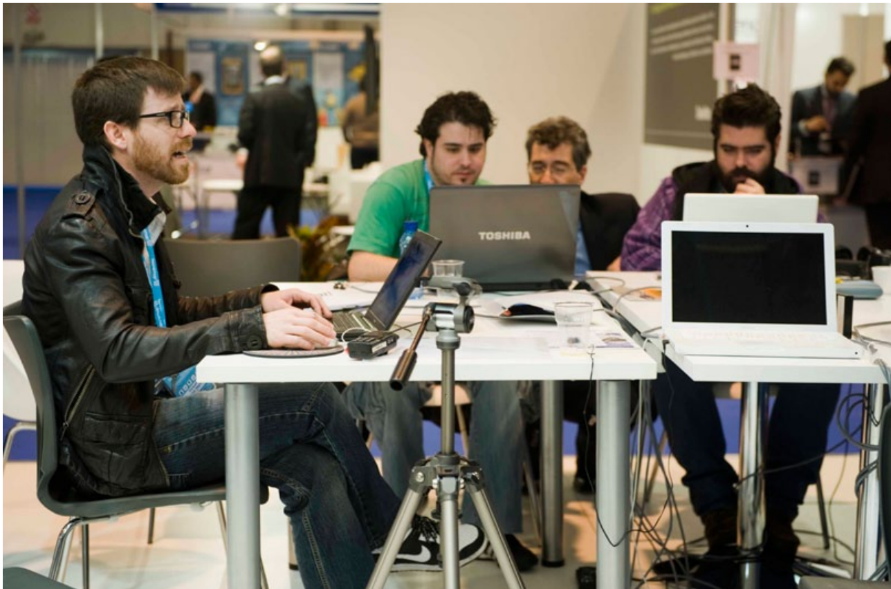
La UE apuesta por apoyar a los jóvenes para la creación de empresas relacionadas con las nuevas tecnologías de comunicación.