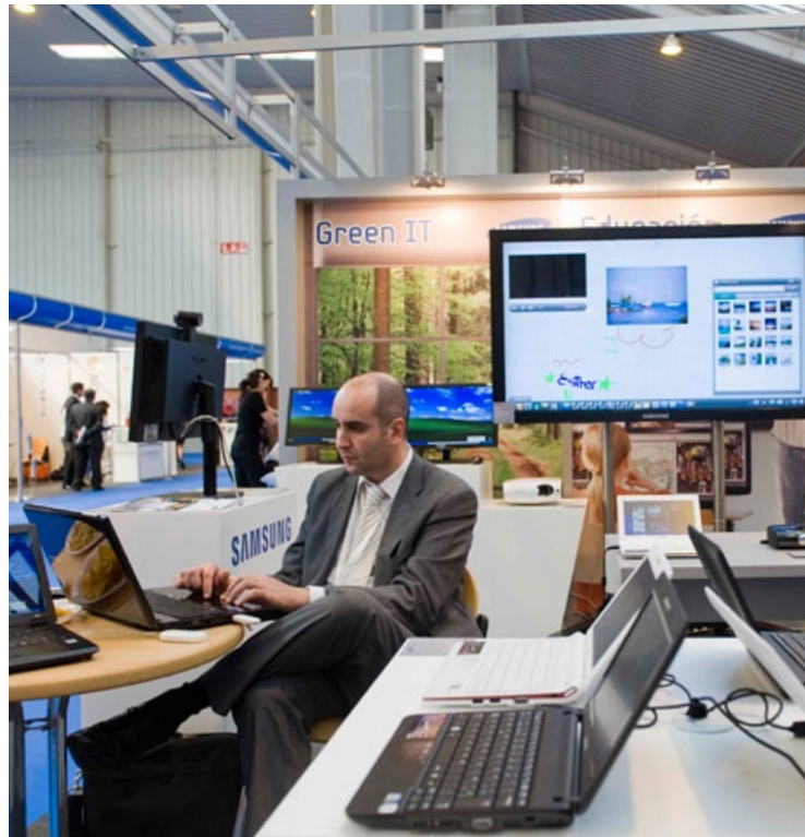
Las empresas que se creen deben ir orientadas a sectores con futuro, como las TIC.

Cuestión a parte es si las subvenciones y ayudas que se conceden resisten algún indicador de eficiencia por simple que este sea. Desde mi punto de vista no, o cuando menos (y entre otras causas por la dificultad en la elaboración de indicadores fiables) es muy discutible. Cierto es que hay sectores o regiones que si no existiera la iniciativa pública sería difícil que se desarrollaran, pero no es menos cierto que en muchos casos la rentabilidad (ya sea medida en términos económicos, sociales o de otro tipo) es más que discutible.