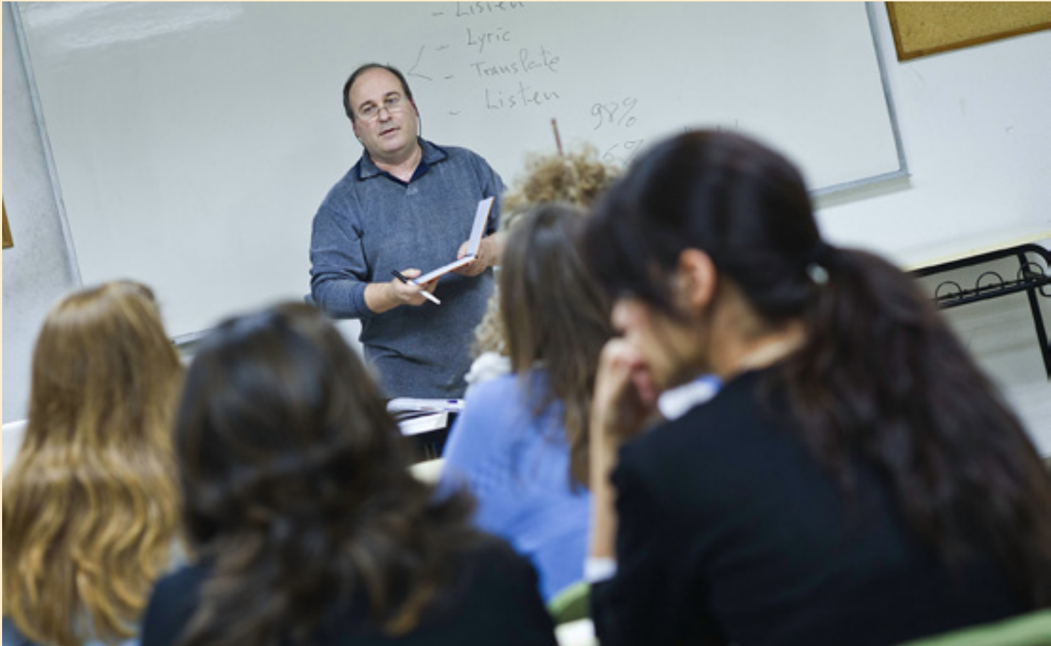
Cada vez son más las academias que ofrecen cursos de idiomas extranjeros.