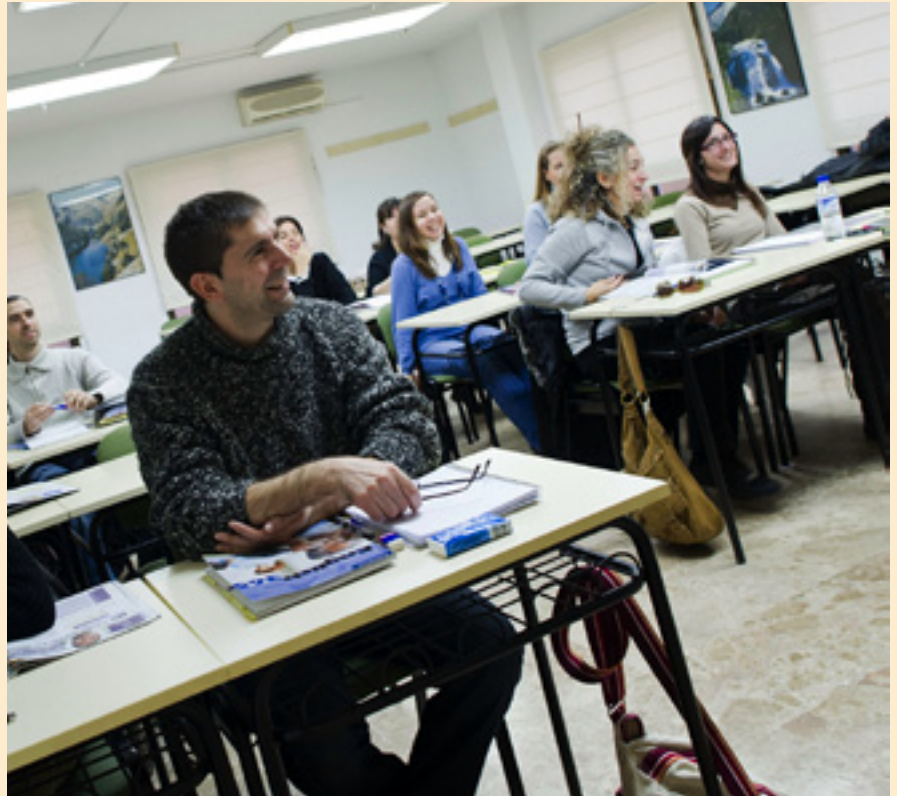
La enseñanza de idiomas puede ser divertida.

En el mundo empresarial, los idiomas en auge vuelven a ser el