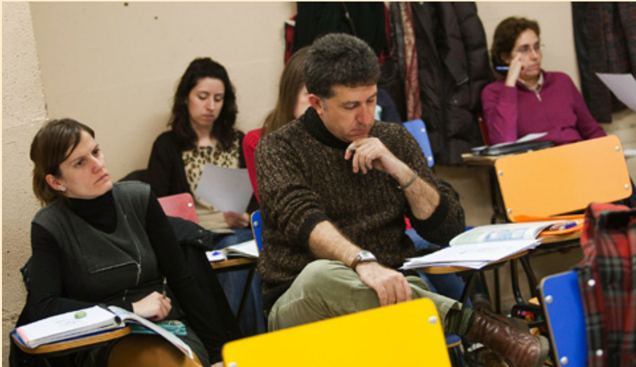
Las mujeres muestran más interés que los hombres en el aprendizaje de nuevos idiomas.

último curso sólo un 53% de los alumnos matriculados en inglés de nivel intermedio aprobaron. El porcentaje en francés en el mismo grado es del 40%, y en alemán sólo del 37%.