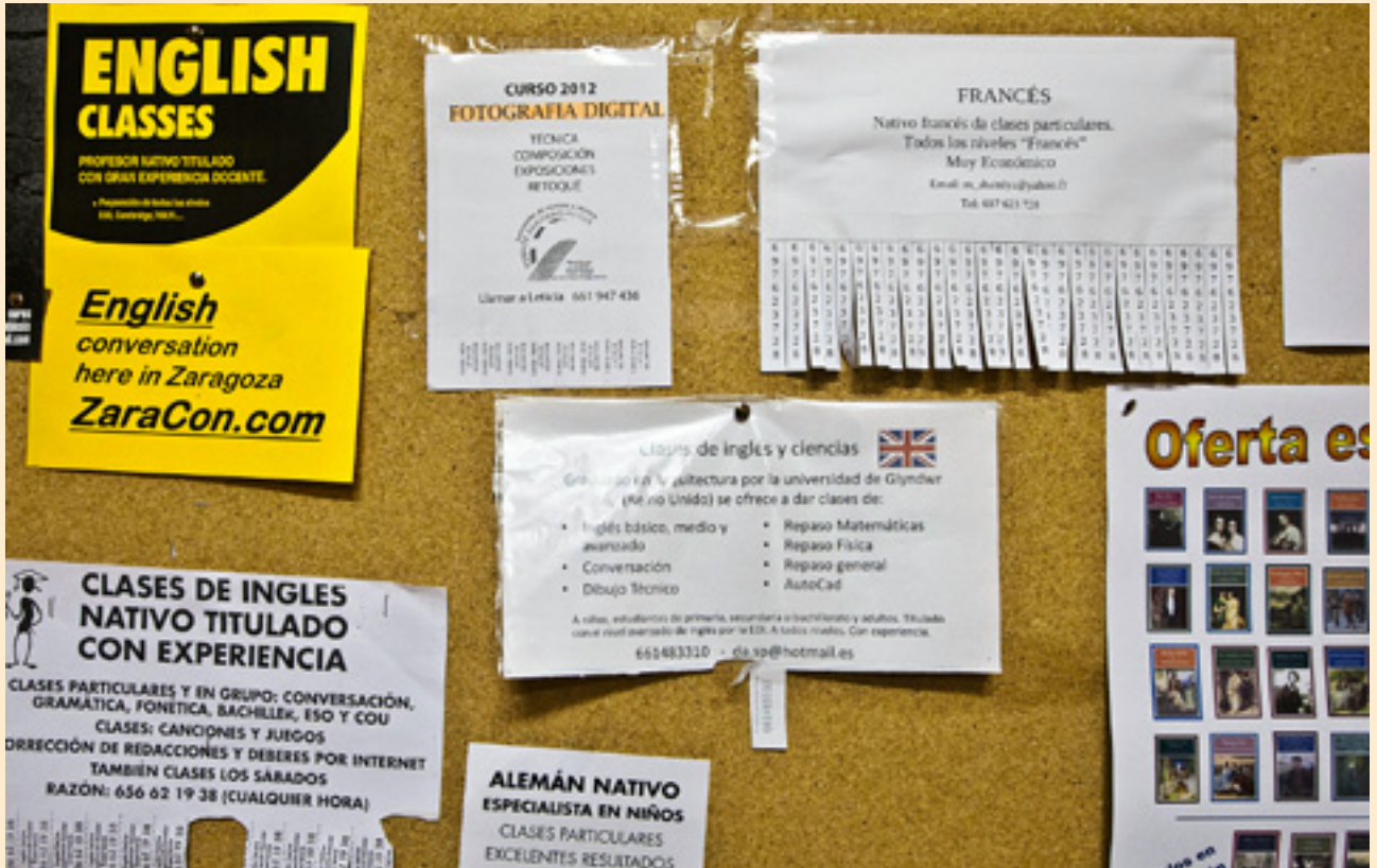
La oferta para aprender nuevos idiomas es cada vez mayor: desde escuelas oficiales, academias, cursos, etc. a clases de conversación con nativos.

Alemania se haya convertido en el motor económico de Europa y cuente con un nivel de desempleo bajísimo ha empujado a cientos de estudiantes, en especial a los más jóvenes, a apostar por su idioma. "Ven la lengua como su futuro", indica la directora. Junto al alemán, también está en auge el ruso, así como el chino, que por primera vez se imparte en la Escuela de Idiomas, por ahora sólo en el nivel básico, en el que están matriculados 125 estudiantes.