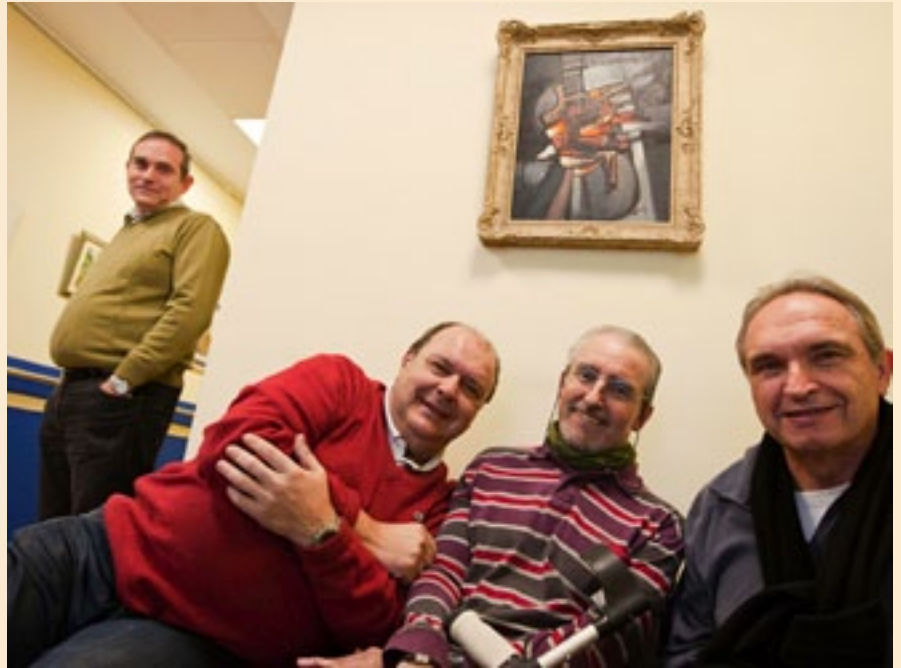
La sonrisa de los asistentes al centro es la mejor señal de los buenos resultados de la rehabilitación integral.

Toda esta actividad se desarrolla en el local estrenado en 2006, donde hay desde sala de ordenadores a despacho para cada profesional. "Se ha quedado pequeño, pero no decimos "no" a nadie, preferimos que vengan dos días en vez de toda la semana que negar la rehabilitación". Deberían tener más espacio "porque cada sala es casi polivalente, cuando hacen salida a piscina o huerto se aprovecha como sala de reunión o para dar cabida a otros afectados". Pero son conscientes de que es mal momento para pedir apoyo... Aunque lo pedirían... "A mí me gustaría tener muchas cosas, pero sobre todo que las sociedad y las administraciones se concienten de la necesidad que existe de