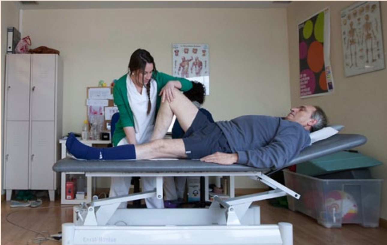
Un centenar de aragoneses acuden al centro que ATECEA tiene en Zaragoza.